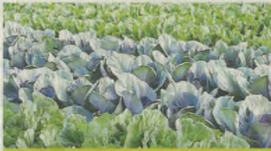
Cultivo de brásicas en una cooperativa de la Región. CRISTINA HEREDIA

Además, «hay que recordar que el seguro agrario es la única herra-