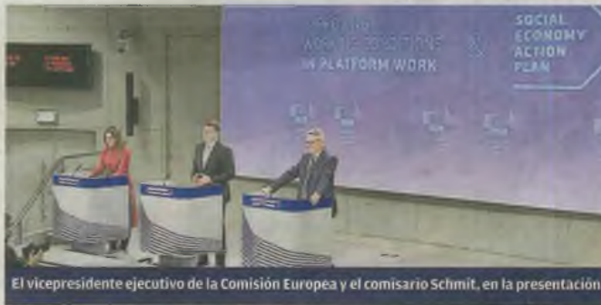
El vicepresidente ejecutivo de la Comisión Europea y el comisario Schmit, en la presentación.