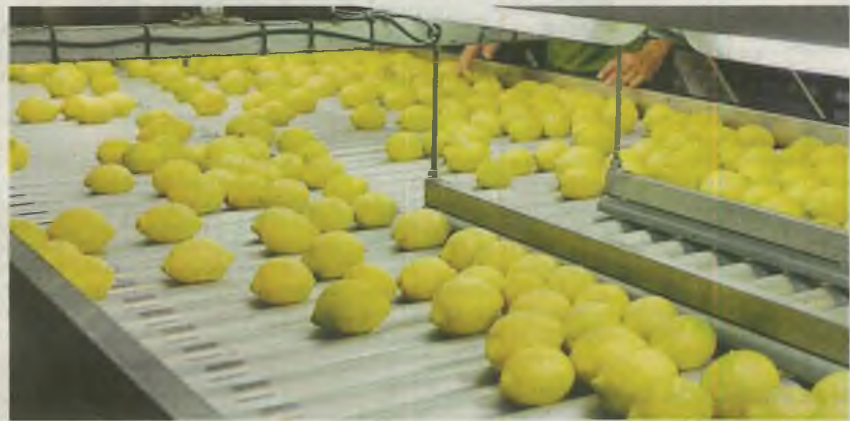
Selección de limones durante la campaña de cítricos. CRISTINA HEREDIA

■ Representantes de las organizaciones agrarias ASAJA, COAG, UPA y la propia Federación de Cooperativas Agrarias de Murcia (Fecoam) consideran que las decisiones unilaterales por parte de Agroseguro ponen en peligro el futuro del seguro agrario. Así, recuerdan que los seguros son la única herramienta de protección para el sector agropecuario en caso de desastre y debe adaptarse a las condiciones actuales de agricultores y ganaderos. PÁG. 2