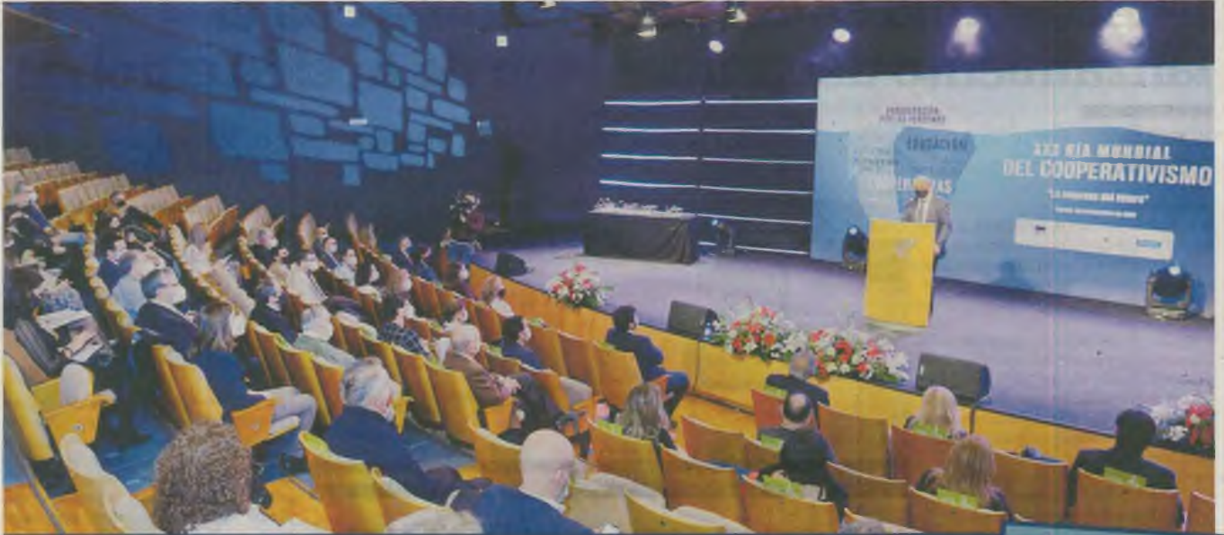
Sobre estas líneas, un momento del XXXI Día Mundial del Cooperativismo (2020). A la derecha, uno de los carteles anunciadores de este año. UCOMUR