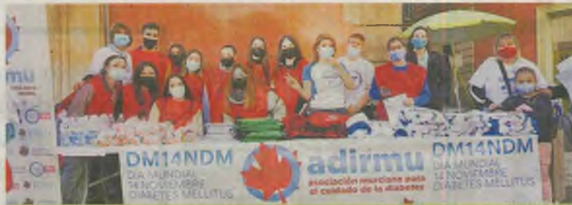
Punto de información durante la jornada de Adirmu, hace unos días. Fecoam

«Los hábitos saludables podrían evitar hasta el 90% de los casos de diabetes tipo 2 y disminuir las complicaciones de esta enfermedad a través del abandono del tabaco, la mejora de la alimentación y la actividad física regular», aseguran. Desde Fecoam remarcan que «nuestras cooperativas están muy implicadas en colaboraciones como esta que fomentan una alimentación sana con productos de calidad que ayudan a la prevención de enfermedades como la diabetes».